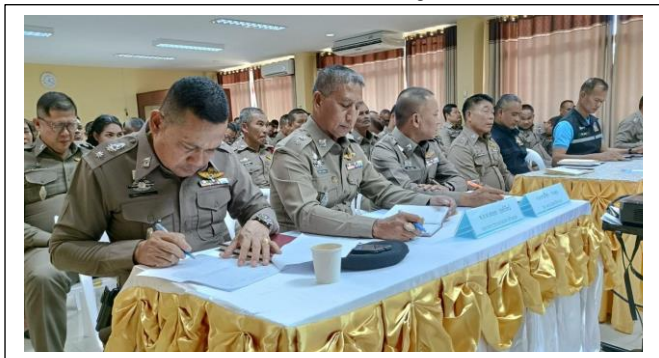
รูปถ่ายผลการดำเนินงานจริง ของสถานีตำรวจของท่าน