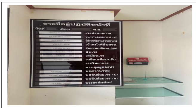
รูปถ่ายผลการดำเนินงานจริง ณ จุดบริการ ของสถานีตำรวจของท่าน